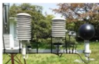
暑さ指数(WBGT)測定装置

暑さ指数を用いた指針としては、(公財)日本スポーツ協会(元日本体育協会)による「熱中症予防運動指針」、日本生気象学会による「日常生活における熱中症予防指針」があります。